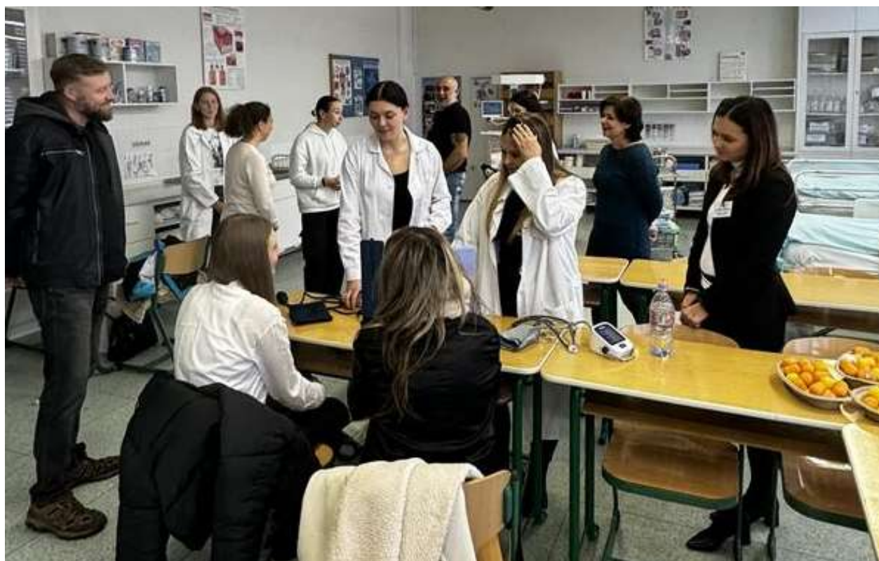
Den otevřených dveří

* předměty absolutoria, ** předmět absolutoria část ošetrovatelství v klinických oborech, Z - zápočet, KZ - klasifikovaný zápočet, ZK - zkouška