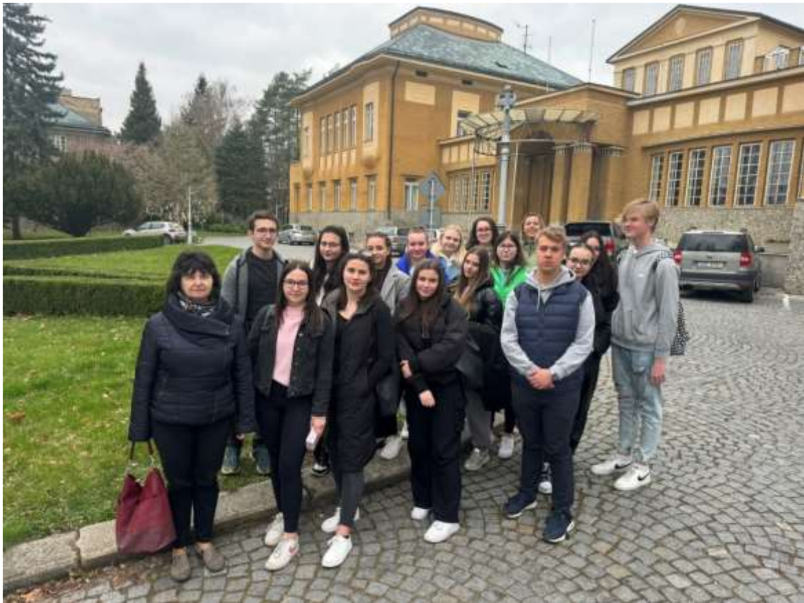
Exkurze třídy 2.O v Psychiatrické nemocnici v Kroměříži