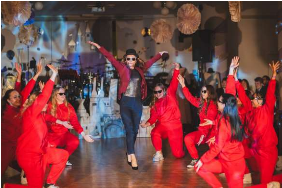
XXIII. Reprezentační ples