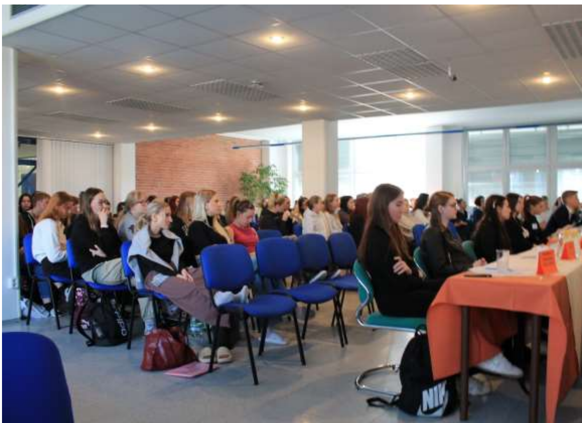
Festival ošetřovatelských kazuistik VOŠ

* Volba jednoho cizího jazyka, ** Označení předmětů absolutoria, Z – zápočet, KZ – klasifikovaný zápočet, ZK – zkouška