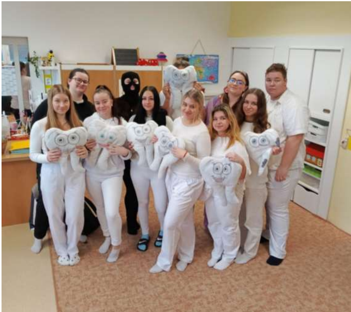
Zdravé zoubky – žáci 3.O