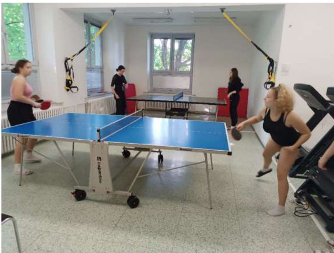
Soutěž ve stolním tenise na Domově mládeže