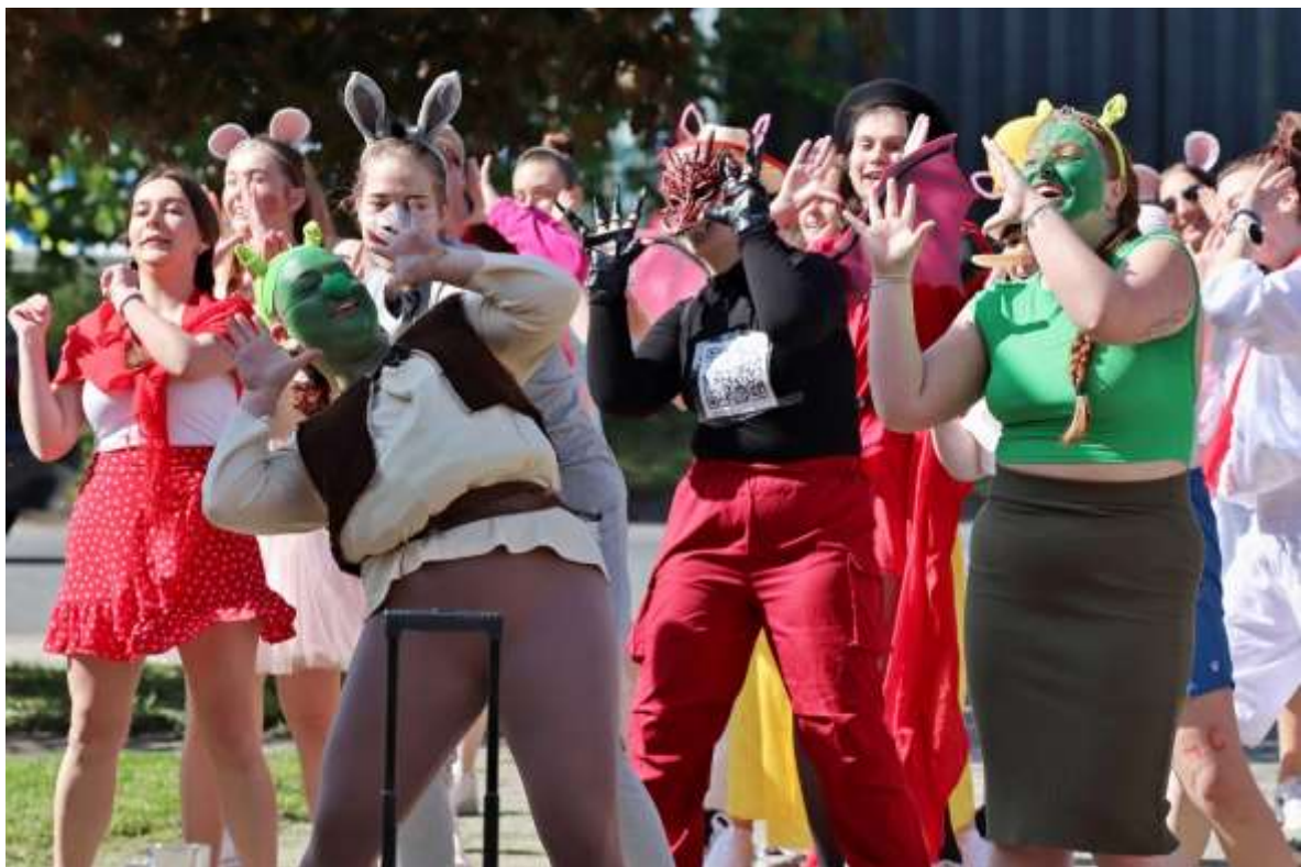
Poslední zvonění třídy 4.C