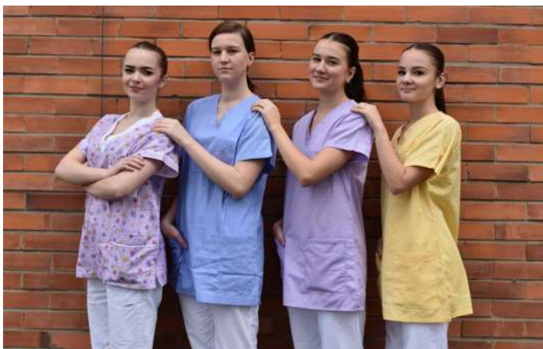
Školní uniformy na odbornou praxi

* V 1. ročníku v 1. pololetí odučeno 6 hodin týdně v předmětu Ošetrovatelská péče a ve 2. pololetí odučeno 6 hodin týdně v předmětu Odborný výcvik.