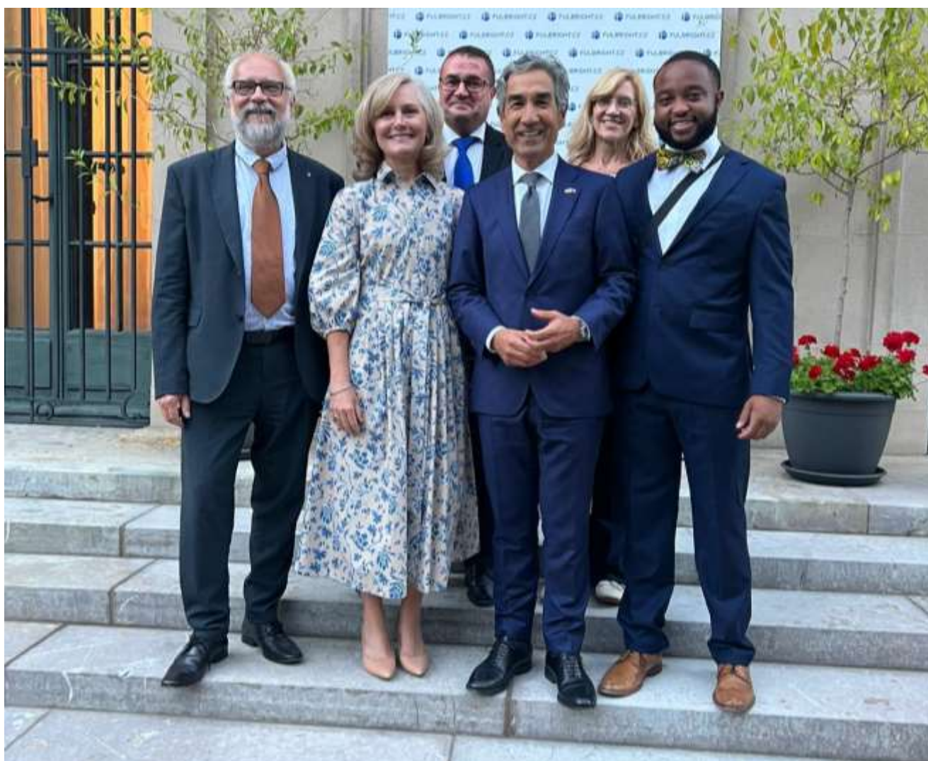
Fulbright – Ambasáda USA