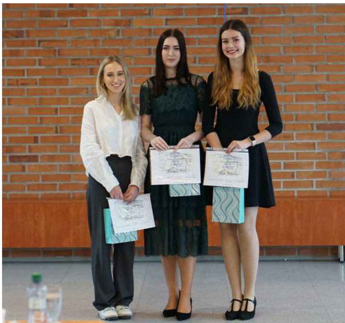
Vítězky školního kola psychologické olympiády