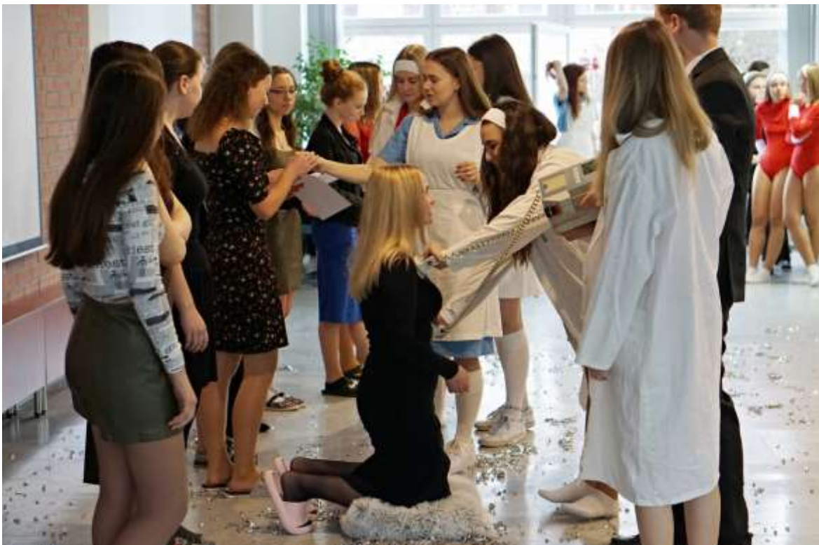
Pasování prváků SZŠ