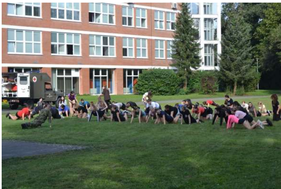
Branně-vědomostní soutěž O pohár ředitele Krajského vojenského velitelství Zlín

Žlutá knihovna je stále k dispozici jak ve žlutém patře budovy školy, tak před budovou školy a nabízí možnost knihy zanechat, nebo si některou z libovolných knih odnést a přečíst. Pro žáky, studenty i zaměstnance školy je tady příležitost nalézt náhodně knihu a potkat autora, nebo příběh, který nečekali.